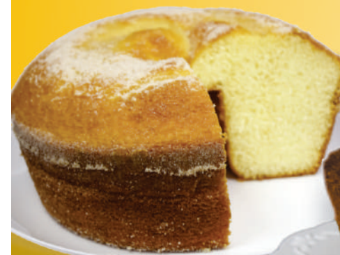
BOLO DE IOGURTE NATURAL

Mais de 40 tipos de Bolos, Tortas e variedades em Quitanda!