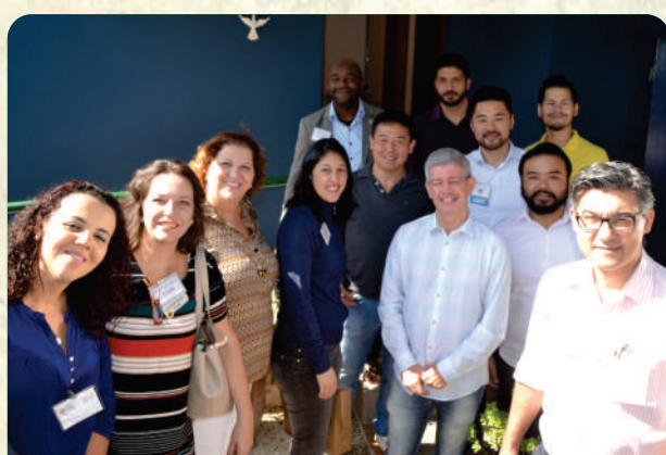
Grupo BNI Ribeirão Pires