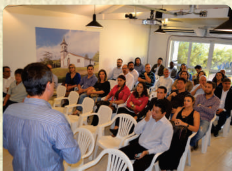
Café com presidente 1ª edição