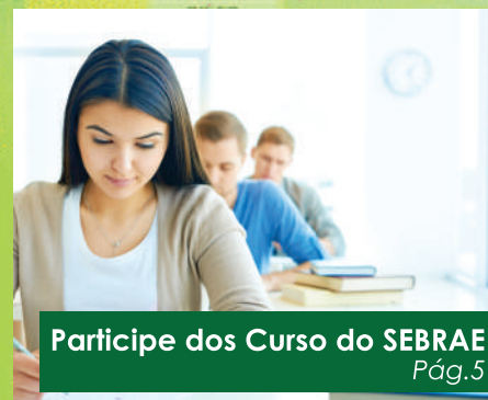
Participe dos Curso do SEBRAE Pág.5