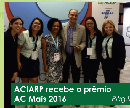
ACIARP recebe o prêmio AC Mais 2016 Pág.9