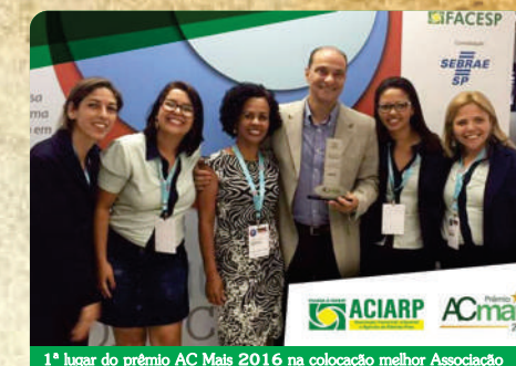
1º lugar do prêmio AC Mais 2016 na colocação melhor Associação Comercial de Porte Médio do Estado São Paulo em produtos e serviços.