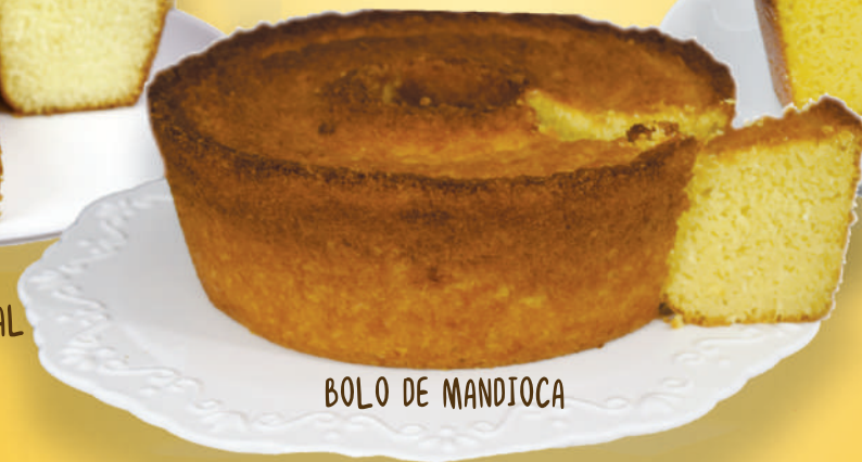
BOLO DE MANDIOCA