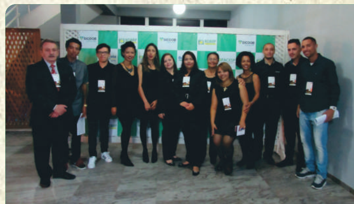
Equipe da ACIARP no Show de Vendas