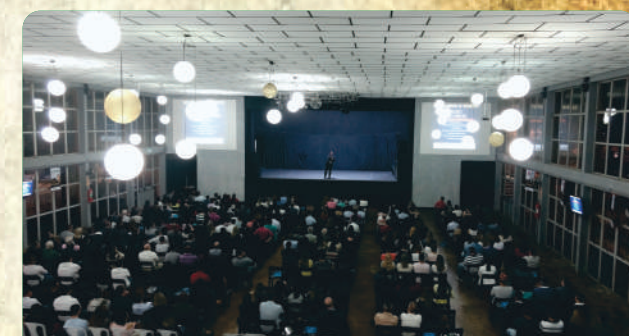
Salão lotado para a palestra Show de Vendas.