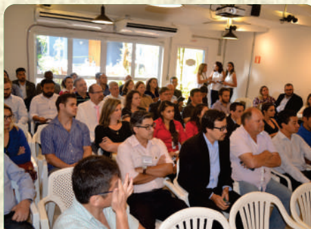
Café com presidente 1ª edição