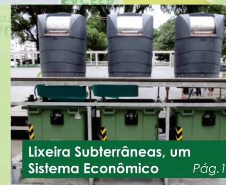
Lixeira Subterrâneas, um Sistema Econômico Pág.12