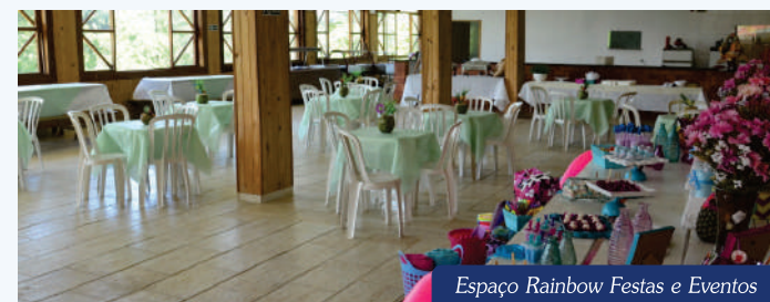
Espaço Rainbow Festas e Eventos

Dispondo de ginásio poliesportivo, campo de futebol, salão de jogos, "playground", amplo salão para festas e eventos (sujeito à contratação), parque aquático formado por oito toboáguas grandes, piscinas e "playground" aquático, com recomendação para o "day use" por meio de aquisição do