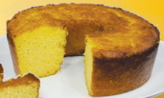
BOLO DE MILHO