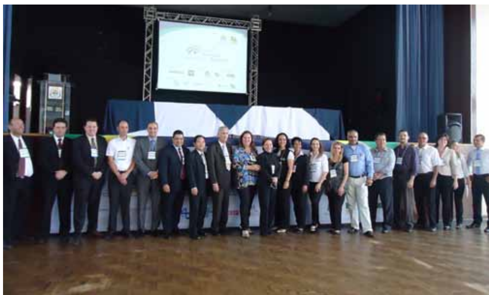
Organizadores do evento e Empresas âncoras.