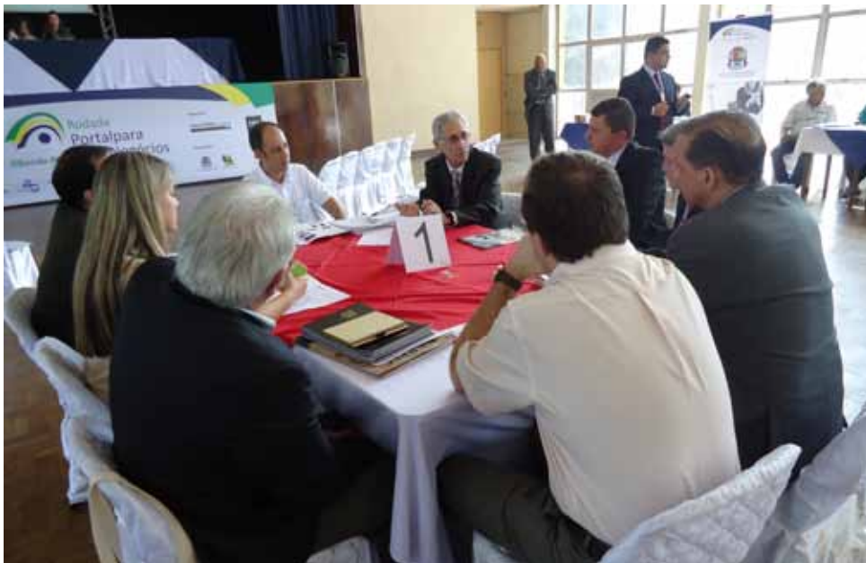
Blitz Projetos Especiais