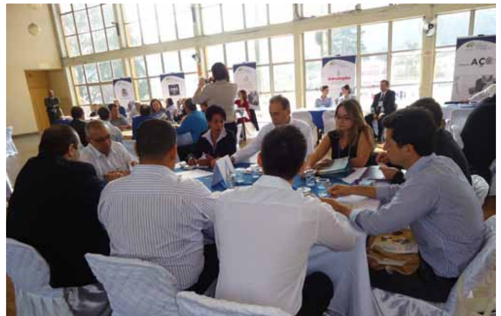
Inox Tech - Grupo Feital