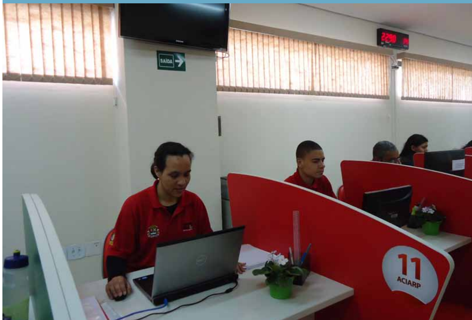
Serviços da ACIARP no Atende Fácil: SCPC, Zona Azul e SEBRAE.