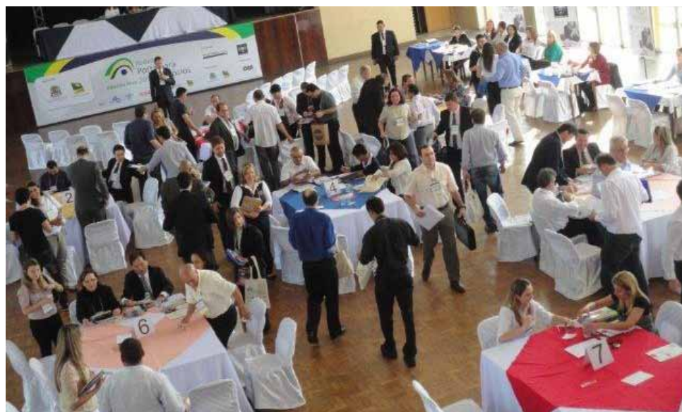
Visão geral das mesas.