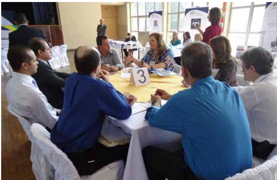
CBC - Cia Brasileira de Cartuchos