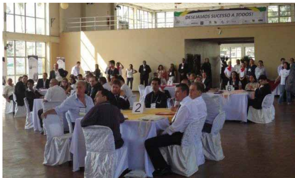
Visão das mesas.