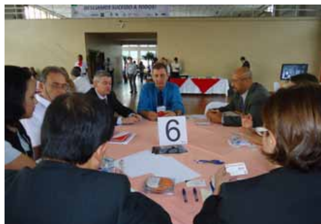
Ouro Fino Indústria de Plásticos Reforçados