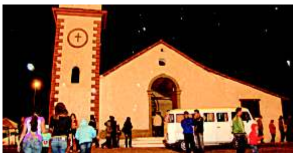
Festa do Pilar