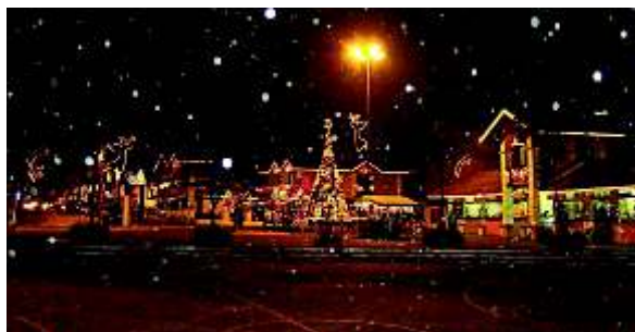
Vila do Doce

Junta Comercial do Estado de São Paulo, Zona Azul, SCPC - Serviço Central de Proteção ao Crédito, Vila do Doce, Festival do Chocolate, Festa do Pilar e Novo Terminal Rodoviário.