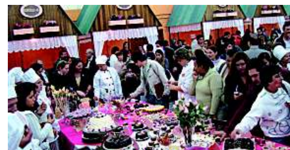
Festival do Chocolate