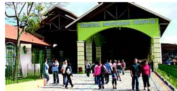
Novo Terminal Rodoviário