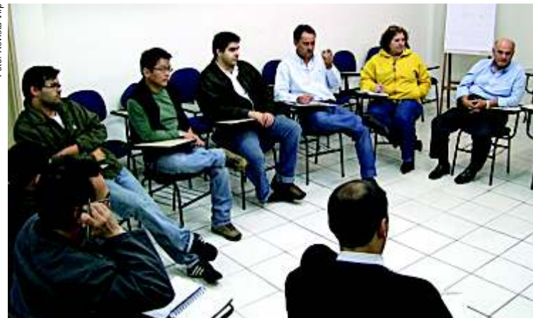
Reunião preparatória da campanha

Passado o Festival do Chocolate, o desafio da ACIARP agora é com a Campanha de Natal 2009, iniciativa realizada tradicionalmente pela entidade. Além de garantir a decoração natalina, a associação, com a participação dos comerciantes, definirá também estratégias de incentivo ao comércio no período de festas de final de ano, tornando as compras na cidade mais atrativas para o consumidor local. O ponta-pé inicial para organização da campanha já foi dado no dia 12 de agosto, em reunião que